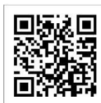
x (旧 Twitter)