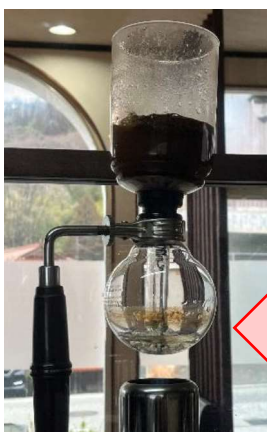
サイフォン式コーヒー

メニュー表によるオーダーの受注 常連さんの身体状況に応じて、食材をきざんだりしながら、注文に応じています。