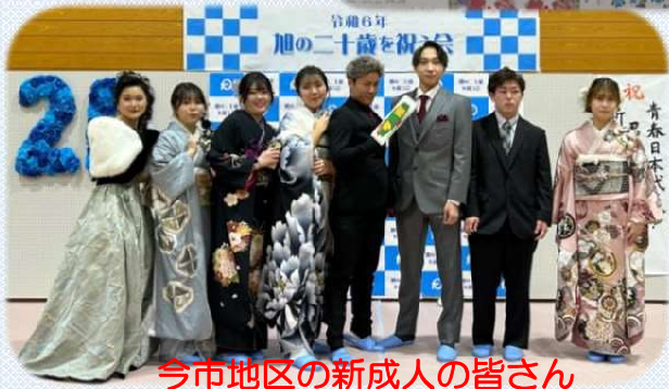
今市地区の新成人の皆さん