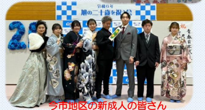
今市地区の新成人の皆さん