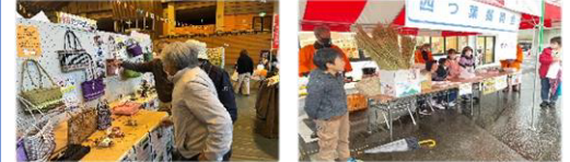
小5の子供達が稲作体験で収穫した米で米粉販売をしました。全完売です！！