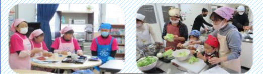
食改さん 美味しく 有難うございます 出来ました！