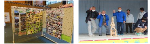
5館連携パネル 積木ゲームに参加