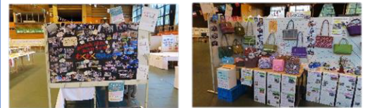
今市まちづくりセンター展示コーナー