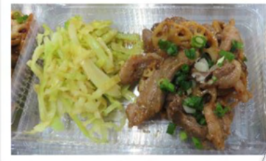
豚肉の梅生姜焼き この日は「猪肉」