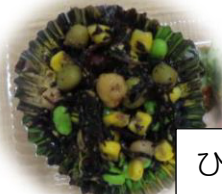
ひじきの豆サラダ