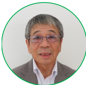
百歳パワーのまち 坂本

今年百歳を迎えられるA嬢 ちゃんは、今は残念ながら老人ホームでの生活になりましたが、坂本の齢とった人たちは、みんな元気でです。 八十歳以上の人達が中心になって、月二回やっておられる「百歳体操」には、いつも十人以上のメンバーが集まります。いいのはお互い声をかけあって一緒に出掛けられ、また一緒に帰って行かれること。九割方は一人暮らしの方達ですが、それで連帯感が生まれ、また毎日元気に暮らせる。声をかけ合う、一緒になって一つのことをする。言いたいこと言う、この三つが齢とった人達のパワーの素です。勿論、私も月に一度は参加しています。他の皆さんから見