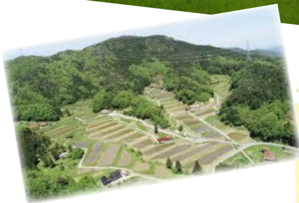
坂本地区の原風景

と私はまだ“若年寄”ですが、いつも約一時間、一生懸命体を動かしておられるのを見ると、「若い」ではなく「まだやれるぞーっ」という気迫さえ感じます。齢とった人が多くても仕方がないと思わないで、齢を重ねた人たちを大事に、そしてその人たちに学んでいくまちづくりをしていきたいと日頃から思っています。